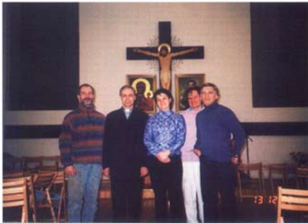
Projektanci, wykonawcy i Ksiądz Dyrektor w trakcie instalacji witraży. (2002 rok).