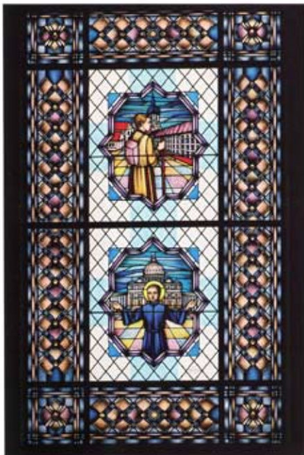
Witraże w szkolnej kaplicy przedstawiające sceny z życia św. Stanisława Kostki. Projekt witraży: Anna i Adam Mizeraccy, wykonawca: Pracownia Zbigniewa Jaworskiego.