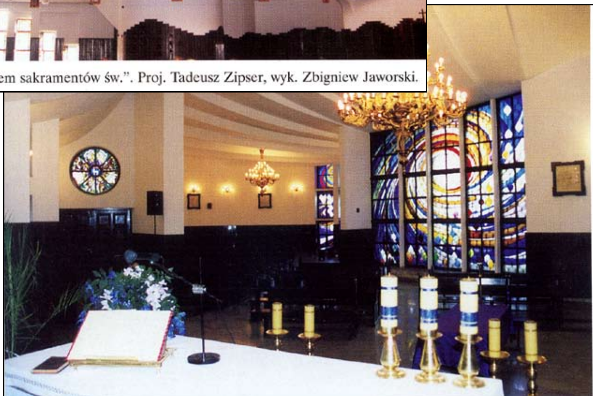
87. Nastrojowe wnętrze kościoła cmentarnego – sklepienie złożone z ułożonych wachlarzowo uskoków, witraż – proj. T. Zipser, wyk. Z. Jaworski, mosiężne żyrandole – wyk. Jan Bagiński.